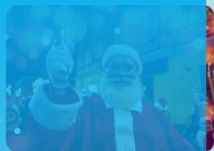
ORSZAK ŚWIĘTEGO MIKOŁAJA