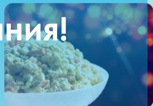
WIELKA KIELECKA SAŁATKA JARZYNOWA